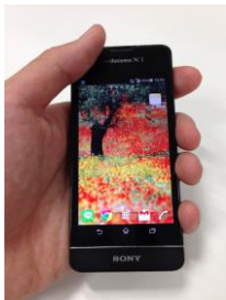
Gガイド番組表 アプリ