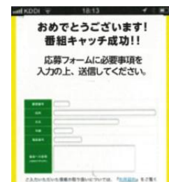
応募フォーム形式の プレゼントページに移動