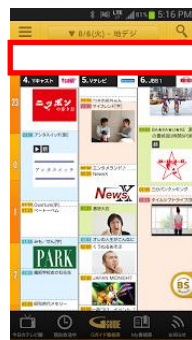
番組表に告知バナーを掲載 (直前にプッシュ通知も実施)

放送数日前より、番組表の広告スペースにバナーを掲示し、「番組キャッチ」の案内を行います。