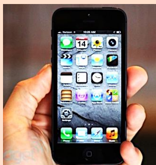
Gガイド番組表アプリ

お手持ちのスマートフォン(iPhone・Android)に「Gガイド テレビ番組表」アプリを事前に無料ダウンロード。