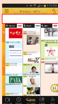
番組表に告知バナーを掲載(直前にプッシュ通知も実施)

放送当日、番組表の広告スペースにバナーを掲示し、「CM キャッチ」の案内を行います。