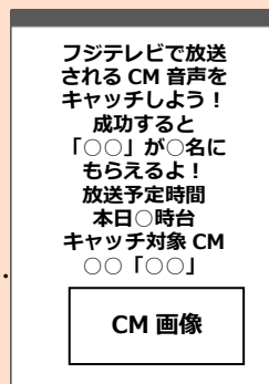
CM キャッチ案内ページにてCM 情報を掲示(文字+画像)