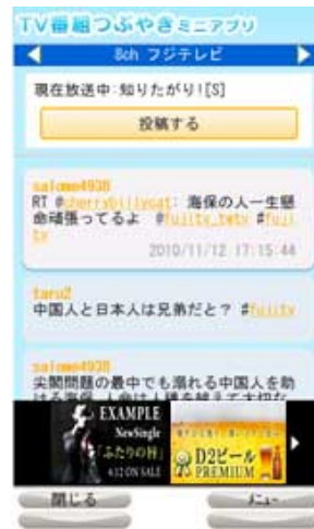
放送局別 タイムライン表示画面