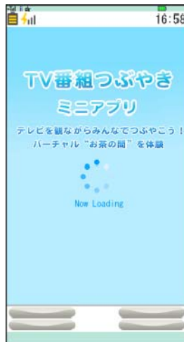
ミニアプリ起動画面