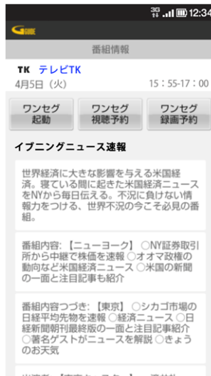
ワンセグとも連携