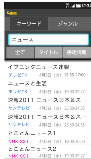
キーワード・ジャンル検索に対応

IPG は「G ガイド番組表」の提供を通じて、テレビの視聴環境の変化や、放送周辺の通信サービス拡大の中、形態の多様化するテレビ番組関連情報を適切に届けるための機能拡張を迅速に推進する環境を整備いたしました。今まで以上にテレビ視聴者のニーズに応える満足度の高いサービス提供を行い、ますますのテレビ視聴拡大に貢献いたします。