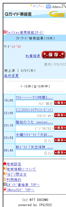
<検索結果イメージ>