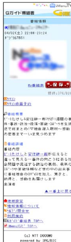
<番組詳細イメージ>