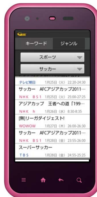
キーワード・ジャンル検索に対応

IPG は「G ガイド番組表」の提供を通じて、テレビの視聴環境の変化や、放送周辺の通信サービス拡大の中、形態の多様化するテレビ番組関連情報を適切に届けるための機能拡張を迅速に推進する環境を整備いたしました。今まで以上にテレビ視聴者のニーズに応える満足度の高いサービス提供を行い、ますますのテレビ視聴拡大に貢献いたします。