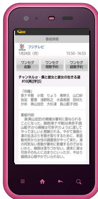
ワンセグとも連携