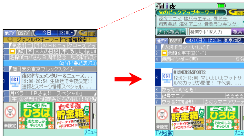
< 従来版 >

従来の i アプリより画面が 33% も大きくなり、番組表も見やすくなりました。