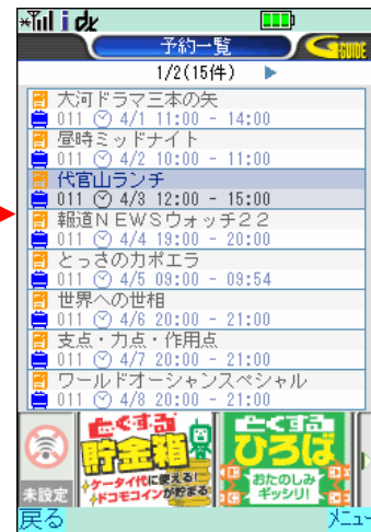
< 予約一覧画面 >