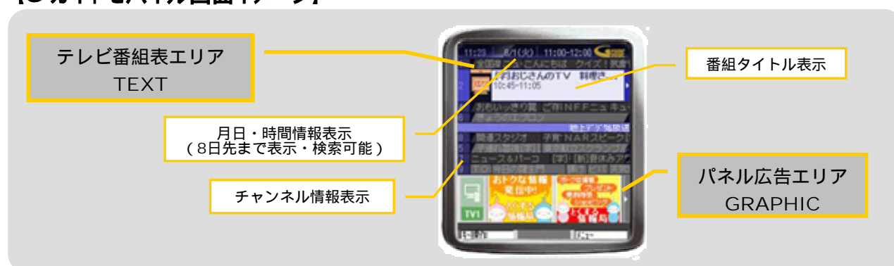
画像はボーダフォン携帯電話向けのアプリ画面です。

さらに、ボーダフォン携帯電話の新機種から搭載が開始されますRSS機能「ライブモニター」において、おすすめ番組などの情報コンテンツを提供します。情報コンテンツのページからは、リンクをクリックすると『G ガイドモバイル』アプリを立ち上げられる機能も搭載しています。(機種限定)