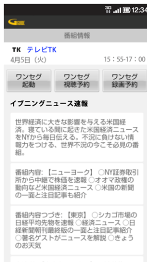
ワンセグとも連携